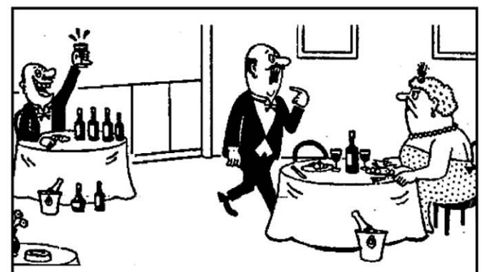
-¡También él festeja todos los años nuestro aniversario de bodas... se acuerda cuando tú lo rechazaste!